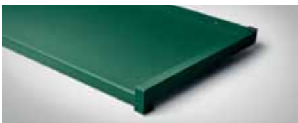
Bestellnr. 6005M, Moosgrün Matt