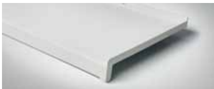
Bestellnr. 703, Weiß