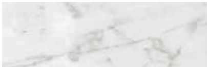
Bestellnr. 65, Marmor Bianco