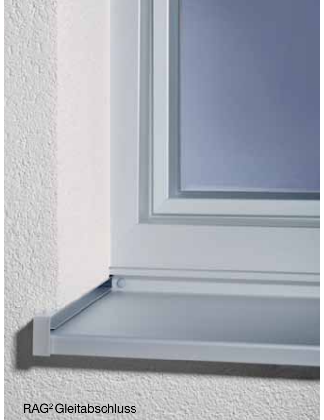
RAG 2 Gleitabschluss