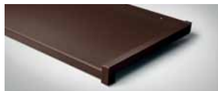
Bestellnr. 8017M, Schokobraun Matt

Die Außenfensterbank Aluminium besticht mit ihrer hochwertigen Verarbeitung und dem umfangreichen Zubehörprogramm. Bei den Oberflächen haben Sie die Wahl zwischen Eloxal- und einer großen Palette an RAL-Farbtönen.