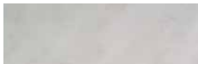
Bestellnr. 62, Carrara