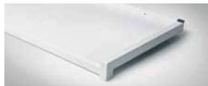
Bestellnr. 9016, Weiß