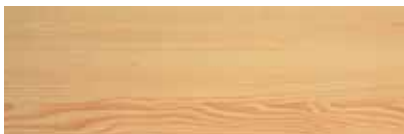
Bestellnr. 54, Kiefer

Die Auswahl an individuellen und attraktiven Designs machen helolit zur idealen Wohnraum-Fensterbank. Die Oberflächen sind robust und pflegeleicht. Widerstandsfähig verleimte, hochfeuchtfeste Spanplatten bilden den stabilen Kern.