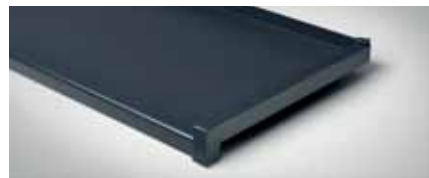
Bestellnr. 7016M, Anthrazitgrau Matt