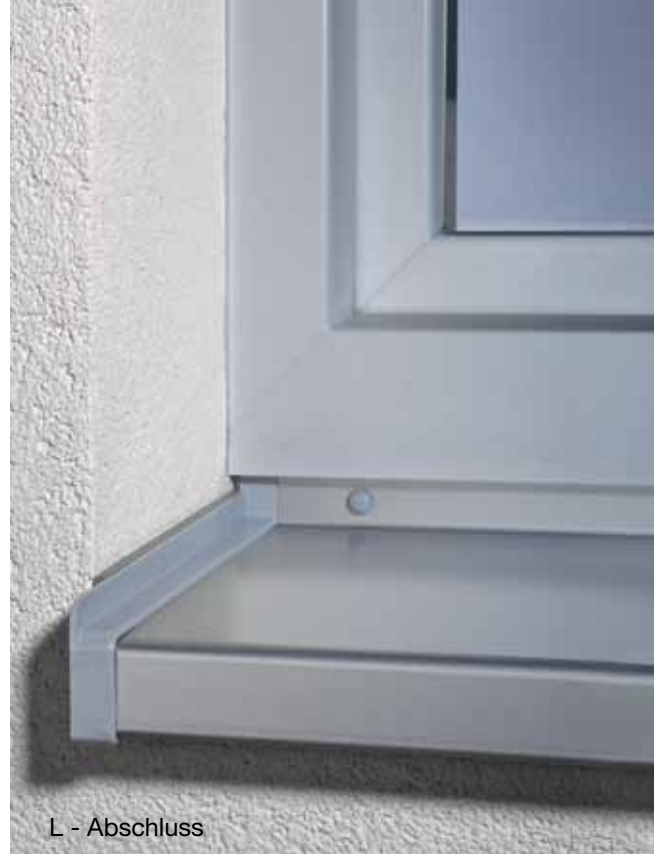
L - Abschluss