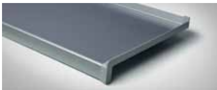
Bestellnr. 701, Silber

Die robuste Außenfensterbank helotop besteht aus feuerverzinktem, an der Oberfläche mit hochwertigem Kunststofflack versiegeltem Stahl. Diese Materialien gewährleisten eine gute thermische Stabilität, hohe Robustheit und Beständigkeit gegenüber Umwelteinflüssen.