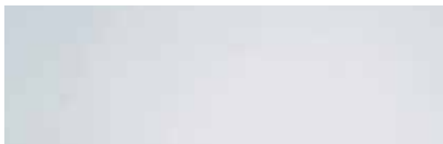
Bestellnr. 66, Weiß